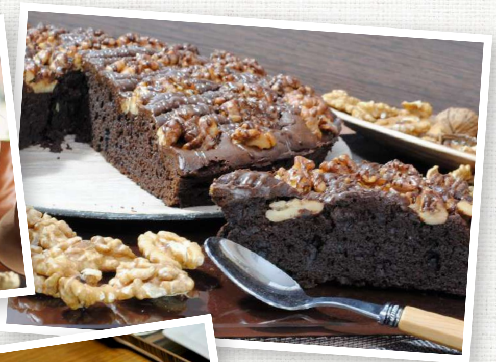
6533 Tarta brownie