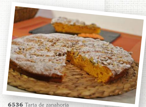
6536 Tarta de zanahoria