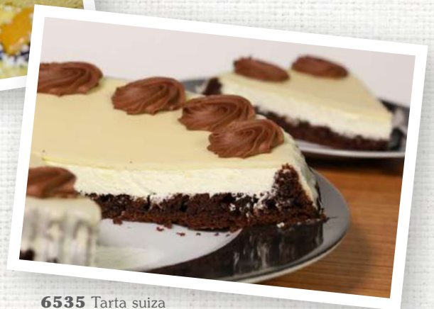
6535 Tarta suiza