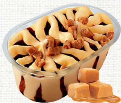
73949 Vasito premium vainilla/caramelo