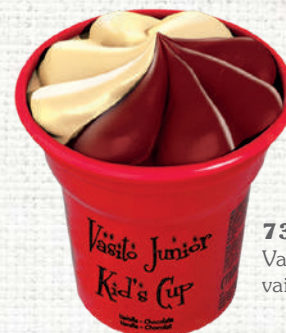
73991 Vasito junior vainilla/chocolate

73976 Vasito premium vainilla cookies Caja 30 piezas x 135 ml