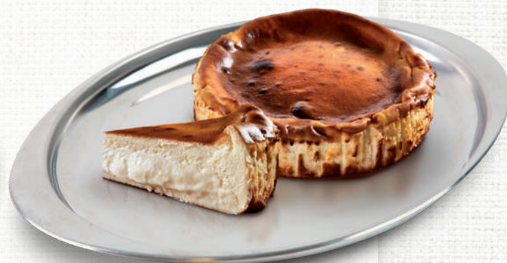
6200 Tarta de queso