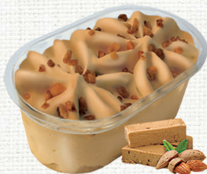
73950 Vasito premium turrón