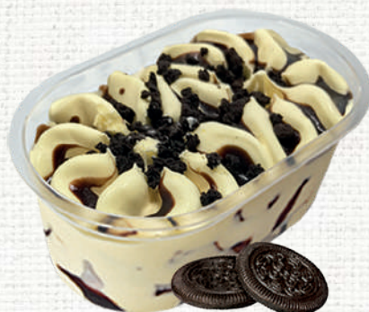
73976 Vasito premium vainilla cookies