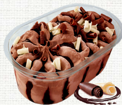
73951 Vasito premium tres chocolates