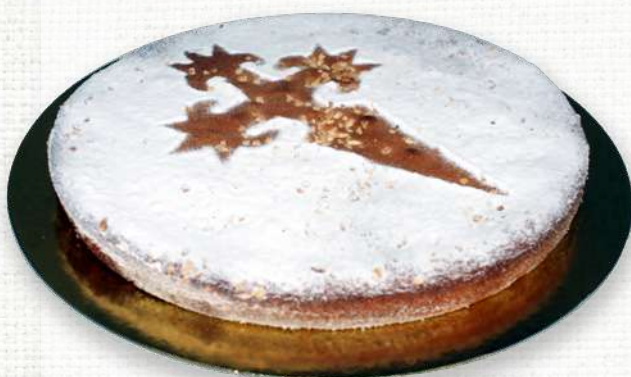
79 Tarta de almendra