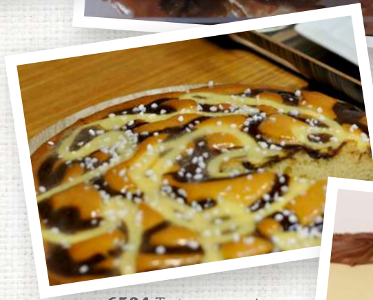
6534 Tarta menorquina