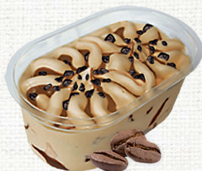
73977 Vasito premium café/caramelo